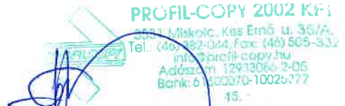
Profil Copy 2002 Kft. Szállító